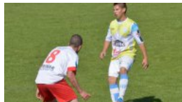
Sirvió para moverse y probar