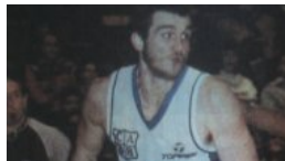
"Jugar en la Selección es algo diferente a todo"