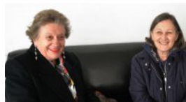
Hacia una sociedad para todas las edades

Quienes leyeron esta nota además leyeron: